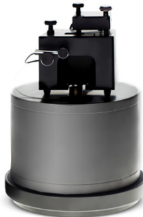
Рисунок 1 – Общий вид зондового микроскопа ФемтоСкан

В данной организации создан уникальный сканирующий зондовый микроскоп ФемтоСкан (рис.1), предназначенный для получения изображения поверхности подопытного объекта путем ее зондирования. Микроскоп позволяет проводить фундаментальные и прикладные научные исследования, осуществлять сканирование как в воздушной, так и в жидких средах.