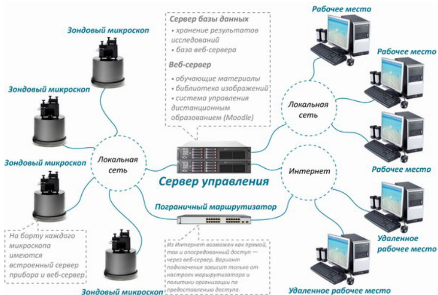
Рисунок 4 - Структура учебно-научной лаборатории зондовой микроскопии на основе оборудования ФемтоСкан [3]

С помощью программы FemtoScan Online можно подключиться к любому микроскопу в любом уголке мира. Это очень удобно, ведь нужен всего один аппарат. Например, студенты работают каждый на своем компьютере и при этом могут в реальном времени наблюдать за процессами, происходящими в микроскопе, получать и обрабатывать новые данные.